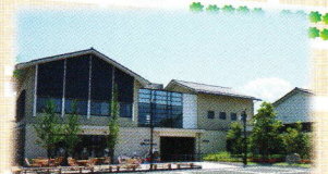
奥の細道むすびの地記念館