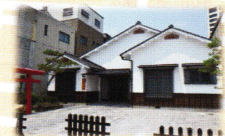
美濃路大垣宿本陣跡